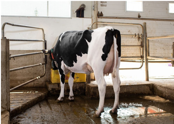
PROGENESIS TOPNOTCH GARNET DAM