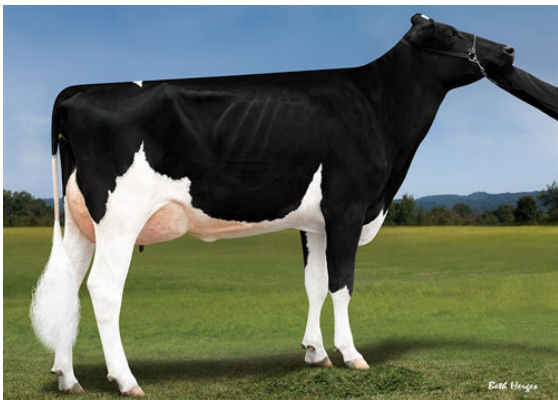
PROGENESIS MONTANA GALATEA GRANDDAM